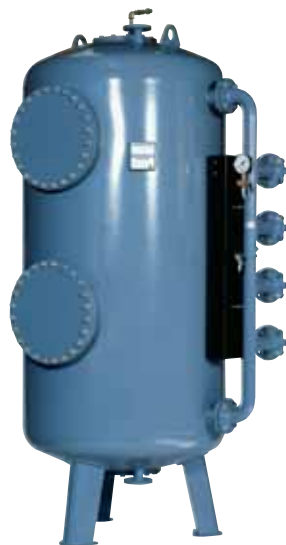
Tlakový filtr typ TFB 14