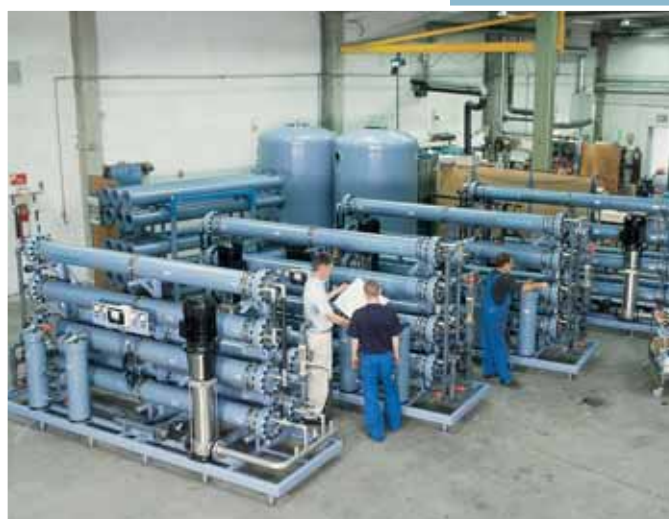
Výroba jednotek reverzní osmózy na úpravu napájecí vody pro parní kotelnu ve farmaceutické společnosti.

Naši servisní činnost na místě zásahu charakterizují promptní identifikace a okamžité řešení problémů. Servisní technici jsou plně kompetentní, servisní auta jsou standardně vybavena širokým spektrem náhradních dílů. Vyrábíme a dodáváme náhradní díly i pro zařízení instalovaná před více než 25 lety.