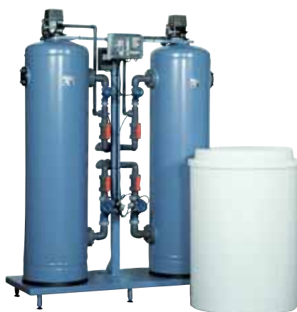
Změkčovač typ SMH 602